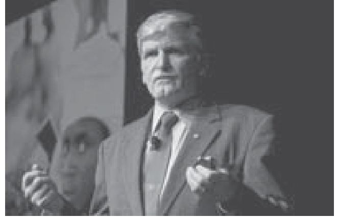
LGen (Ret'd) the Honourable Roméo Dallaire