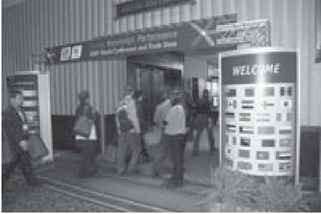
مدخل مؤتمر الجمعية الكندية للتدريب والتنمية

3 ومنظمو شبكة داخلية يعملون على ربط المبتكرين مع بعضهم البعض والممارسات الجدي تطوير الشبكات الاجتماعية التي بشكل طبيعي.